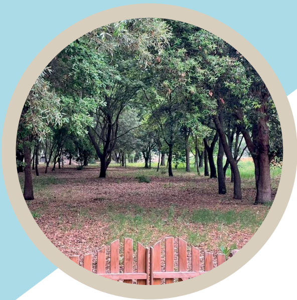
Bosco del Centro Diocesano Comunità Il Sogno